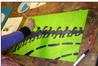
Workshop bij Atelier Helderrood

Naast de lessen binnen de school gaan de leerlingen van klas 1 en 2 regelmatig een bezoekje brengen aan bedrijven of volgen een workshop buiten de school. De leerlingen van het profiel Creatief hebben 16 november in De Fabriek een workshop gevolgd van Dick Lubbersen (Atelier Helderrood). Ze werden voor hun opdracht